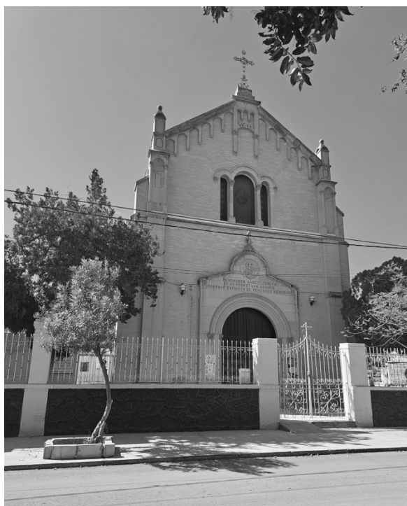
Figura 6. La capilla de San José

Fotografía: Chantal Cramausse, 2023. Arriba de la puerta de entrada figura la frase en latín: “Yn honorem sancti Joseph et ad perpetuam domine Josephae Espinosa de Ponchaux”. El latín dista mucho de ser correcto, pero se podría traducir de la siguiente manera: “Erigida en honor a San José a perpetuidad por Josefa Espinosa de Ponchaux.” 26