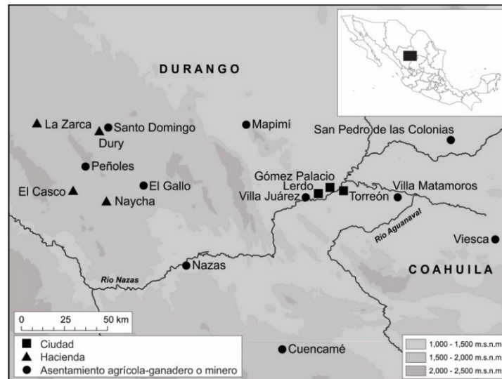
Figura 2. Mapa de referencia

Francisco Ponchaux no volvió a Francia con el cuerpo expedicionario en 1866. Se arraigó en el norte del estado de Durango (figura 2).