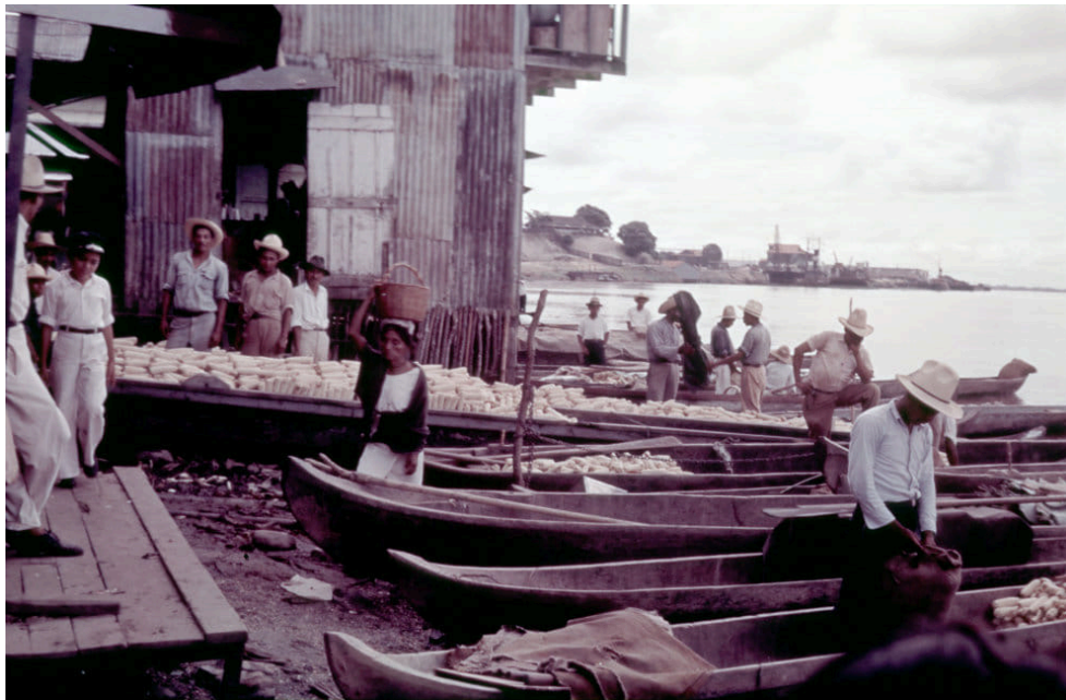
Figura 3. Hombres y mujeres vendiendo maíz a la orilla del río, Minatitlán, Veracruz. 4 de septiembre de 1937.