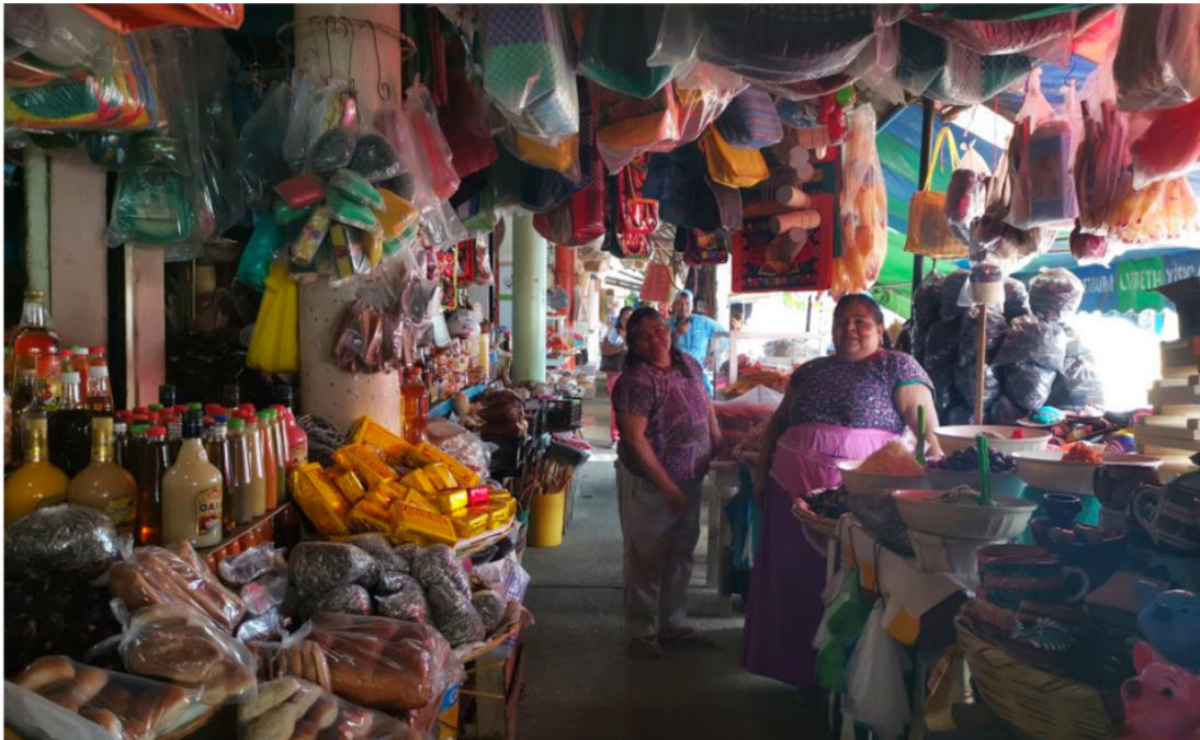
Figura 8. Mujeres istmeñas en el Mercado Solidaridad