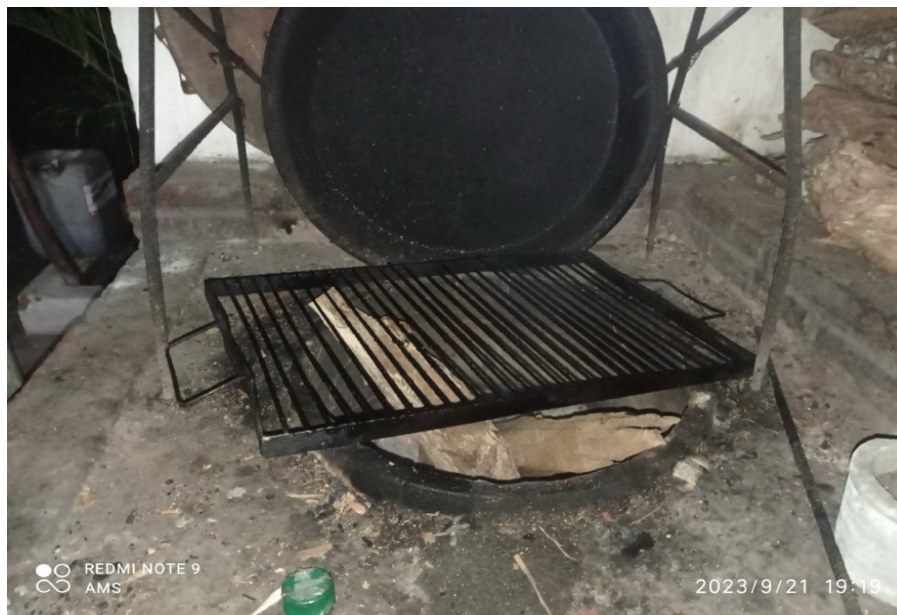
Figura 5. Fotografía: Comiscal para elaborar totopos y cocinas pescado y carne, Colonia Cuahtémoc, Minatitlán, Ver.