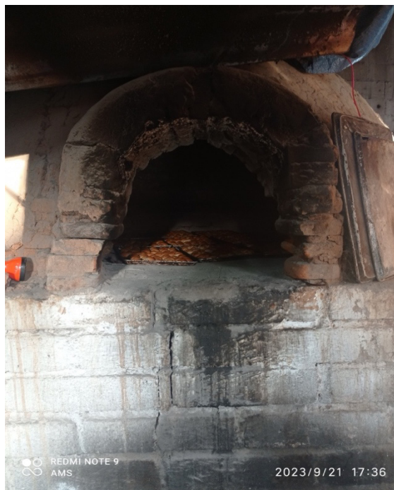
Figura 4. Fotografía: Horno de barro del istmo en la colonia Cuauhtémoc, Minatitlán, Ver.