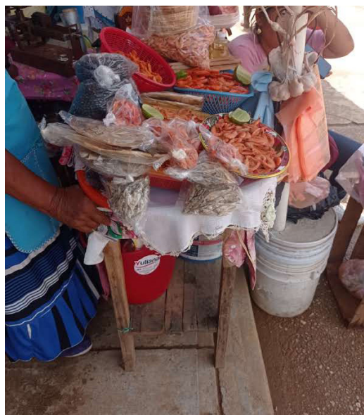
Figura 6. Fotografía: Puesto de productos del istmo oaxaqueño en mercado de Cosoleacaque, Veracruz.

Fuente: Angeles Magaña Santiago. Septiembre, 2023