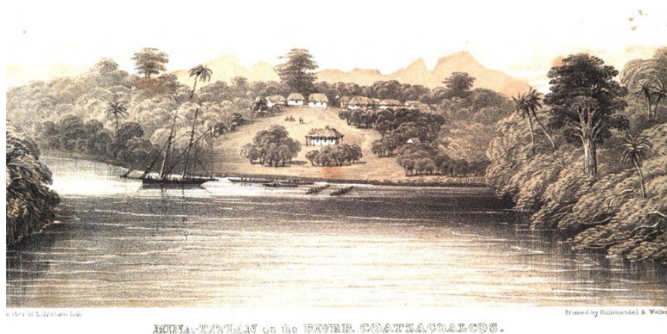
Figura 2. Litografía “Minatitlán en el río Coatzacoalcos”