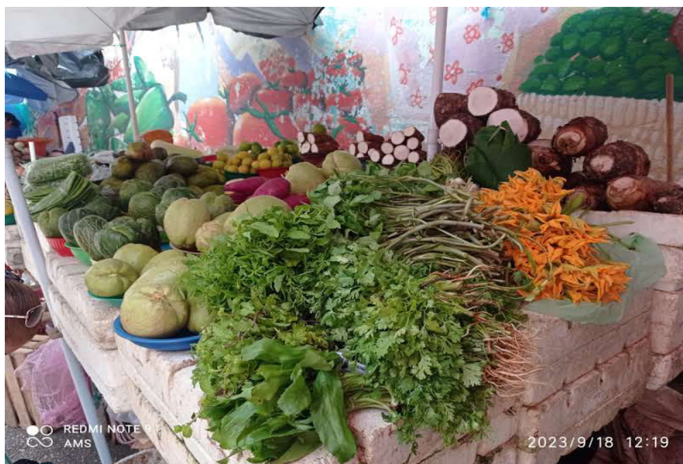
Figura 7. Productos de la ribera del río: Yuca, chayote de cáscara gruesa, rábanos, cilantro, nopales, limón criollo.